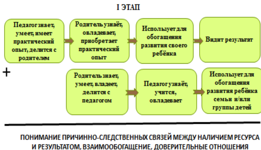
Рис.1. Механизм использования ресурса семьи в условиях дошкольного образовательного учреждения (первый этап)

Педагогами детского сада № 119 ОАО «РЖД» разработан механизм использования ресурсов семьи, воспитывающей ребёнка с ограниченными возможностями здоровья. На рисунке 1 представлен первый этап использования ресурсов семьи детским садом на основе партнёрских отношений, на паритетных началах. Каждый из социальных партнёров обогащается ресурсами другого, происходит взаимовыгодный обмен.